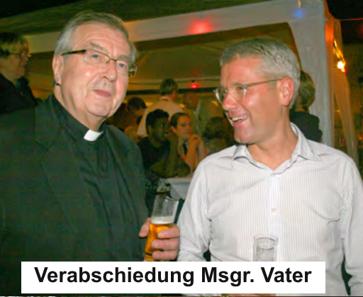
Verabschiedung Msgr. Vater