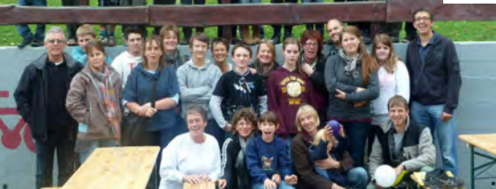
Familienwochenende in Simmerath