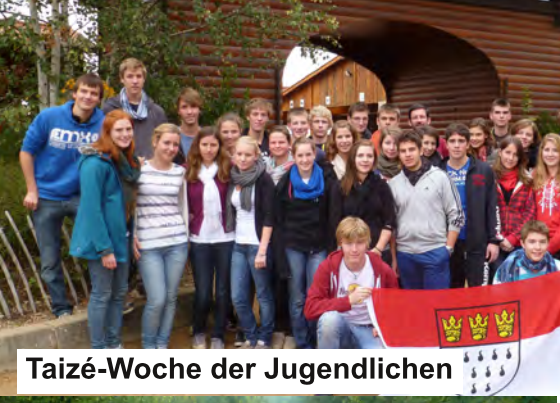
Taizé-Woche der Jugendlichen