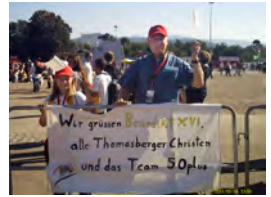
Thomasberger Gemeindemitglieder vertreten die Pfarrei beim Papstbesuch in Freiburg

Sa. 03.12. nach der Vorabendmesse um 17:00 Uhr: Nachtwanderung der Ministranten nach Heisterbach, dort: schaurig schöne Führung durch die Klosterlandschaft im Fackelschein.